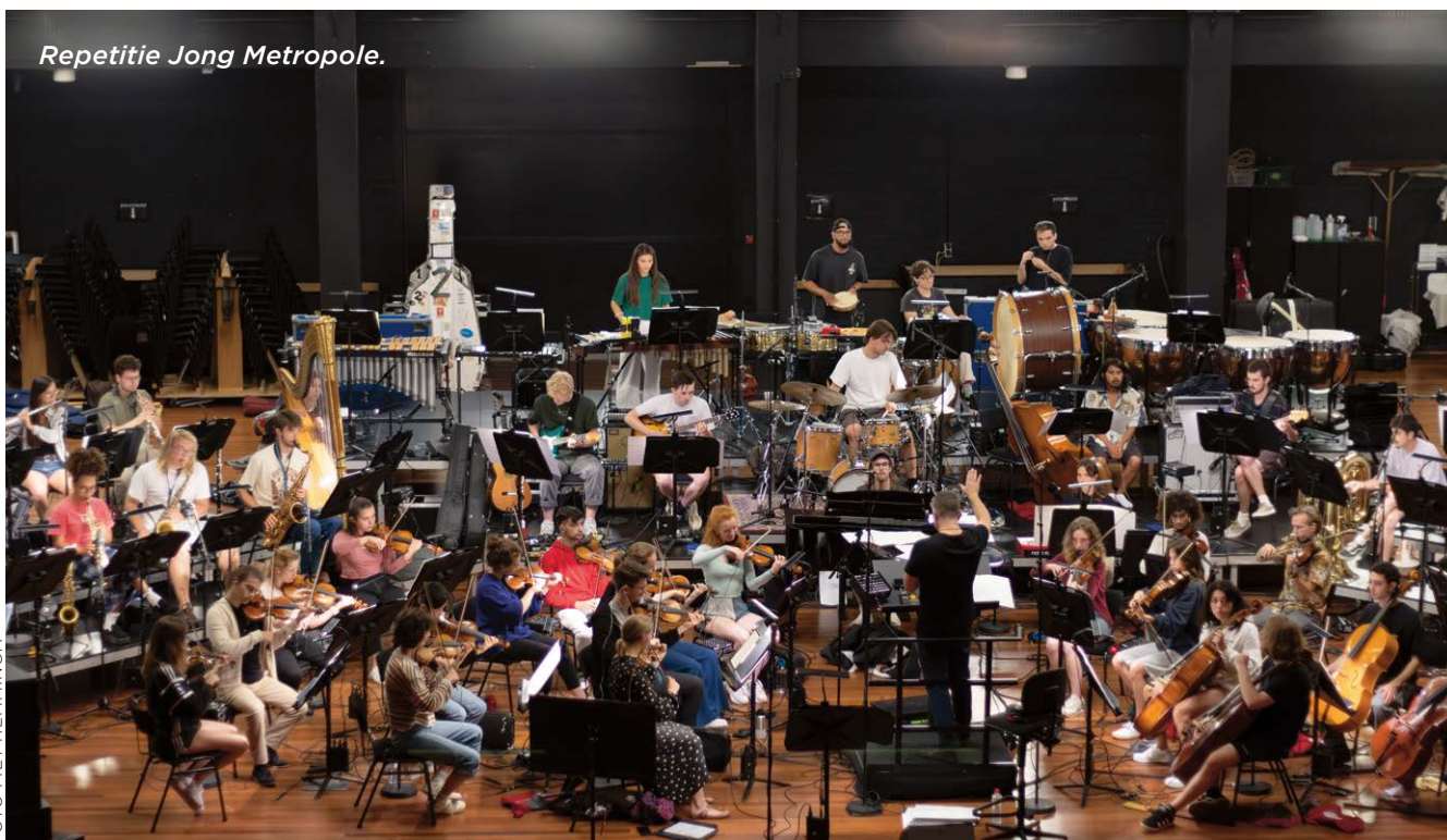
Repetitie Jong Metropole.