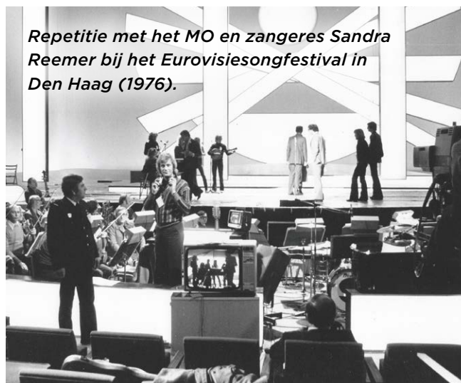
Repetitie met het MO en zangeres Sandra Reemer bij het Eurovisiesongfestival in Den Haag (1976).