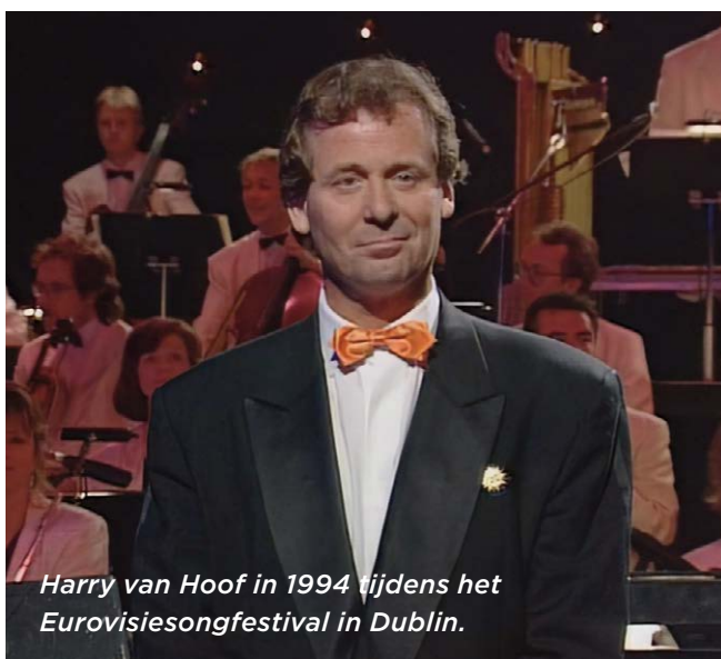
Harry van Hoof in 1994 tijdens het Eurovisiesongfestival in Dublin.